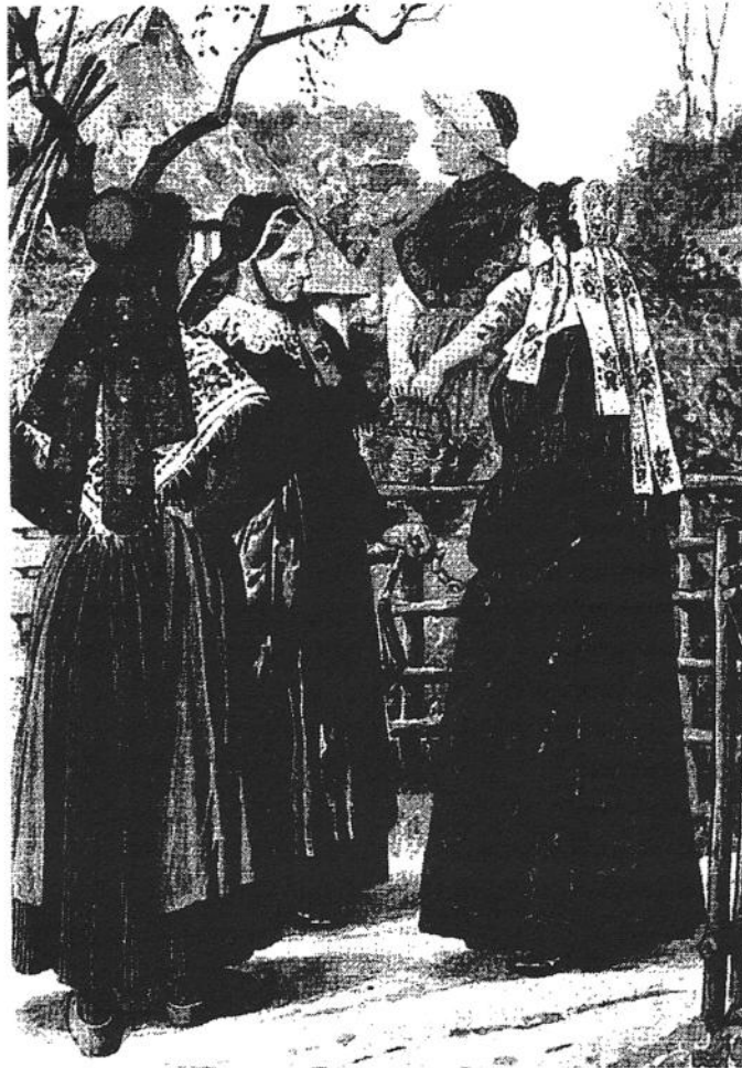
Emsländische Sonntagstrachten und HümmlingerArbeitskleidung, nach Franz Jostes, 1904.

Am Sonntag, 13. Juli, ist ab 15 Uhr die Spinngruppe des Heimatvereins Lathen zu Gast im Archäologischen Museum in Meppen und demonstriert im Rahmen der Sonderausstellung „Schmuck und Tracht im Wandel der Zeit“ den Weg von der Wolle zum fertigen Garn.